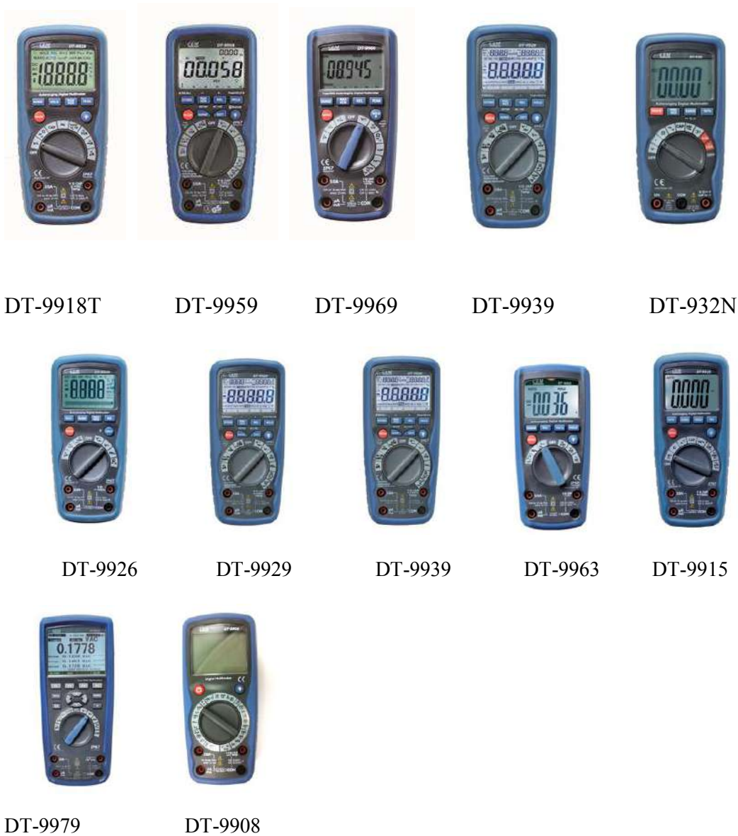
Рисунок 1. Фотографии общего вида мультиметров цифровых серии DT