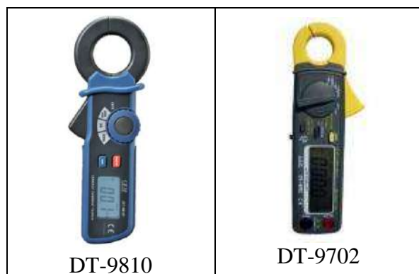
Рисунок 1. Фотографии общего вида клещей серии DT