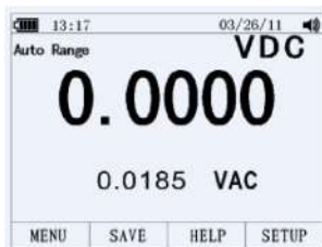
Подрежим DC AC

В режиме измерения AC– и DC–сигналов недоступны дополнительные режимы измерений: PEAK , Hz , ms , % , REL , MIN , MAX , REL .