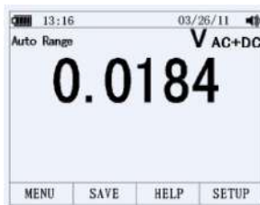
Подрежим AC + DC